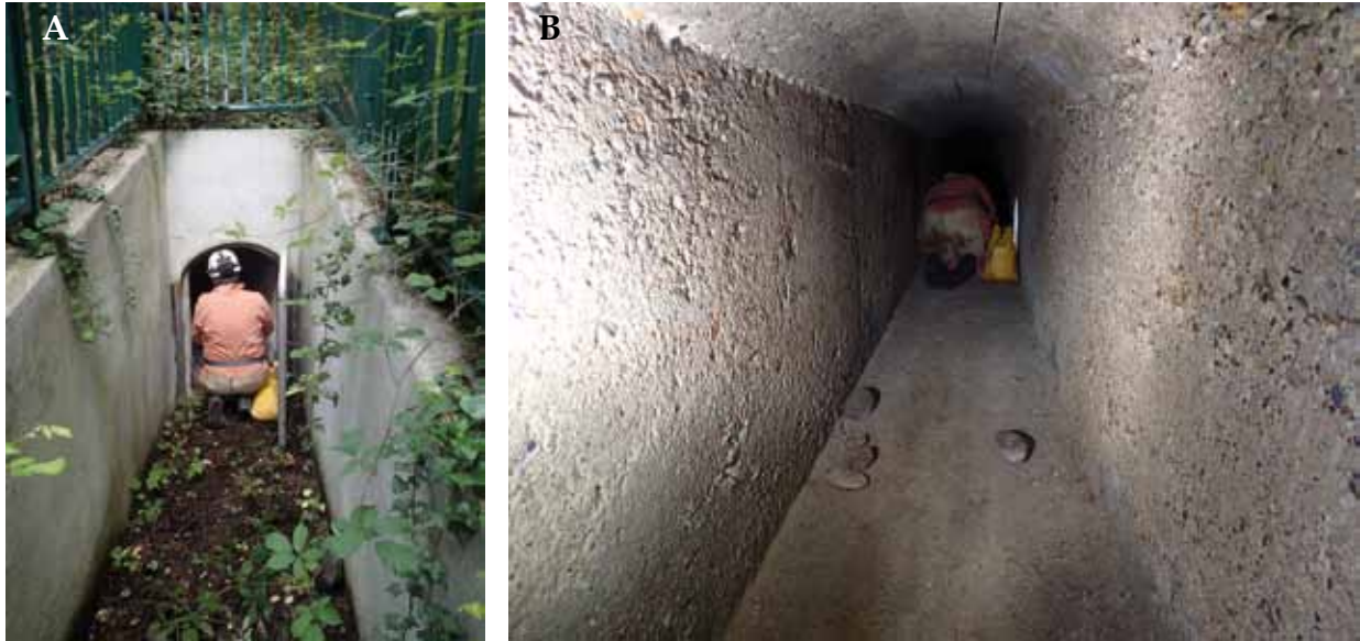
Figure 3.- A-B, Galerie Chevallier, Lyon : A, Entrée de la galerie ; B, Intérieur de la galerie.

L'habitat dans lequel l'espèce a été observée correspond à ses exigences écologiques mais est quelque peu singulier car il s'agit d'une cavité artificielle située dans la ville de Lyon. En effet, la Galerie Chevallier supérieure est localisée dans le coteau en rive droite de la Saône, sous un petit parc du 9 e arrondissement de Lyon. C'est une galerie horizontale, pratiquement entièrement bétonnée, d'une soixantaine de mètres de long et d'un mètre de hauteur environ (fig. 3). Cet habitat rappelle notamment les galeries souterraines du Château des Sforza situé au cœur de la ville de Milan où l'espèce a également été observée (ZANON, 1996 ; ISAIA et al. , 2007).