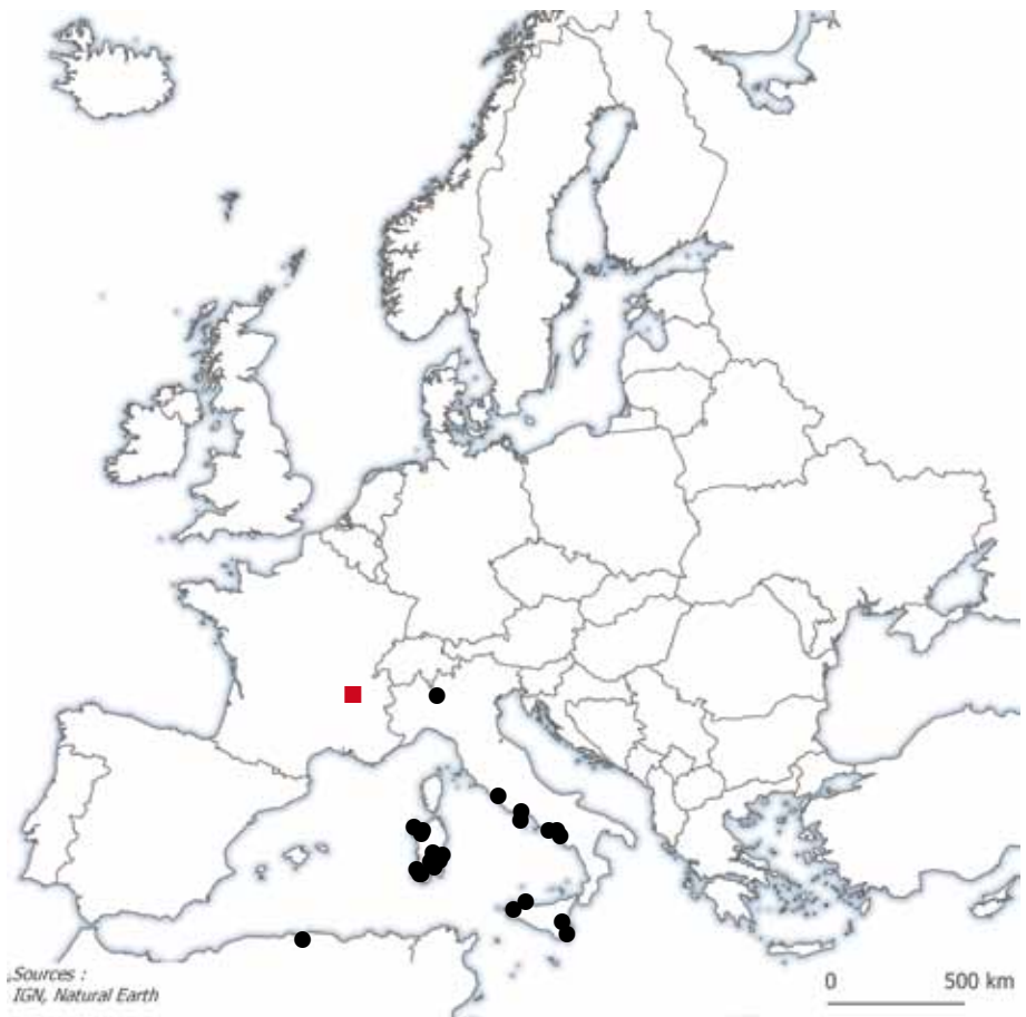
Figure 4.- Répartition actuelle de Paraleptoneta spinimana : points noirs (●), données anciennes; carré rouge (■), nouvelle donnée.

la mesure où elle n'avait jamais été signalée jusqu'à aujourd'hui alors que de nombreux inventaires de cavités du Sud de la France ont été menés par le passé (SIMON, 1907, 1910, 1911) et plus récemment (BRIGNOLI, 1970 et 1979b ; DÉJEAN et al. , 2019 ; Ligue insulaire spéléologique corse, 2019). Cependant, il se pourrait également que la présence de Paraleptoneta spinimana à Lyon soit en fait liée