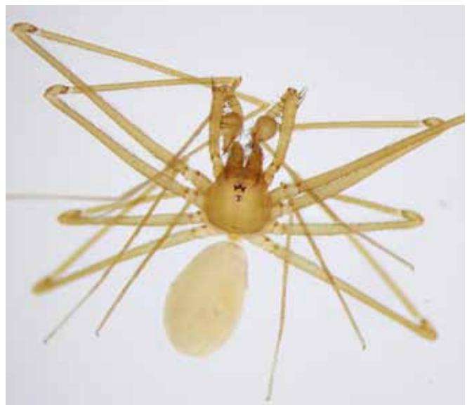
Figure 1.- Habitus du mâle de Paraleptoneta spinimana de Lyon.

La séparation entre les yeux antérieurs latéraux et les yeux médians postérieurs correspond approximativement à 1,2 fois le diamètre d'un œil, sachant que tous les yeux sont sensiblement égaux et d'un diamètre d'environ 0,04 mm. Cette distance entre les yeux antérieurs et postérieurs